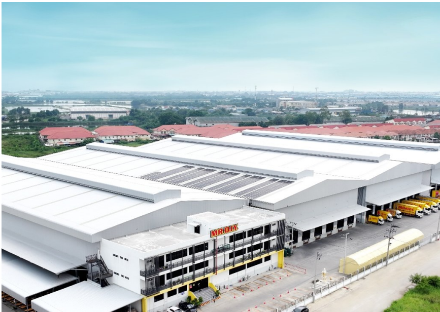
โซล่าเซลล์ที่ศูนย์กระจายสินค้ากลาง