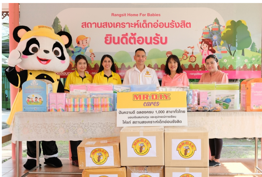
มอบเงินสมทบทุนและอุปกรณ์การเรียน