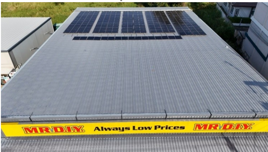
โซล่าเซลล์ที่ร้านค้า