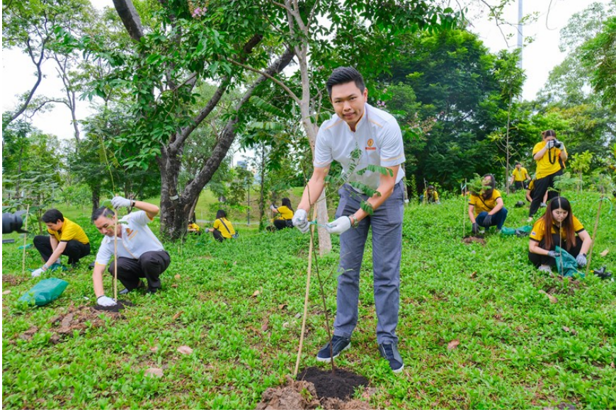
ร่วมสร้างสิ่งแวดล้อมยั่งยืน จับมือกรุงเทพมหานคร เพิ่มพื้นที่สีเขียว