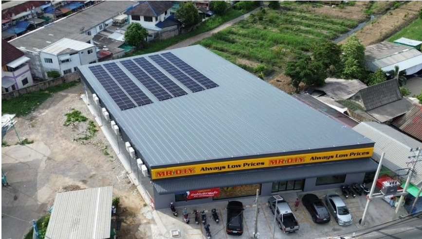
โครงการติดตั้งระบบผลิตไฟฟ้าพลังงานแสงอาทิตย์ที่ร้านค้า