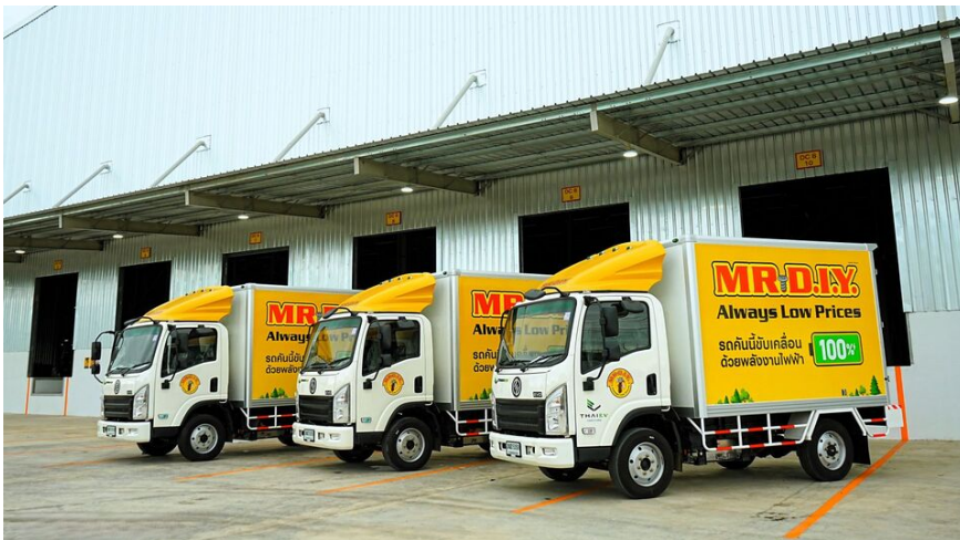
รถบรรทุกทุกไฟฟ้า