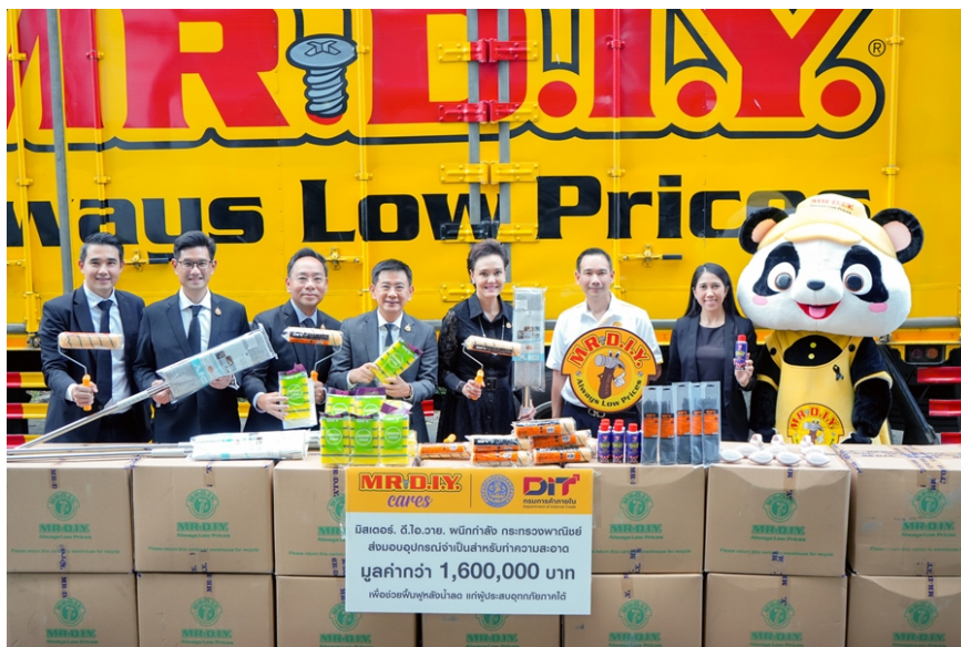
โครงการ รวมใจไทย พั่นแดนใต้